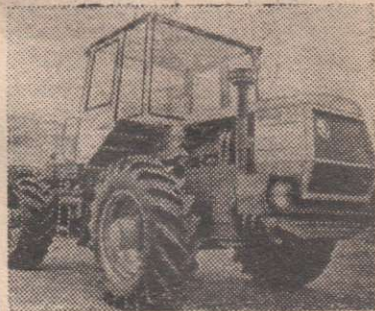
ЧЕХОСЛОВАКИЯ. Новый трактор-тягач — «Т-180» производства Либерецкого автозавода.

Более двадцати процентов всей выпускаемой чехословацкими предприятиями сельскохозяйственной техники поставляется в Советский Союз.