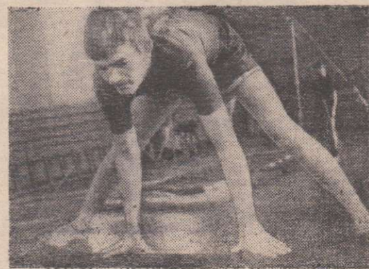
Фото В. СТРЕПЕТКОВА.

На снимках: курсанты СПТУ-14 на занятиях в спортивном зале.